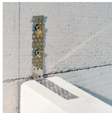
Dodatečné ukotvení k nosné konstrukci pomocí hřebíků s nerezovou úpravou.