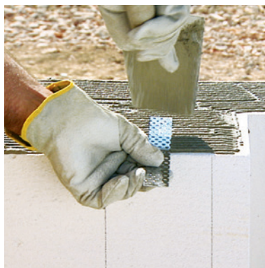
Spojka zdiva aplikovaná při stavbě nosné konstrukce.