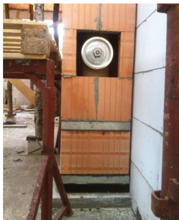
Ukázka realizace s použitím GMZ