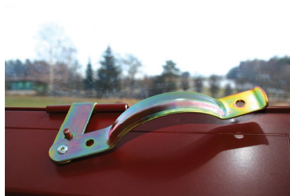
Obr. č. 5