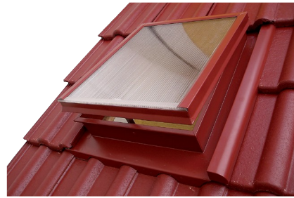
Obr. č. 4b