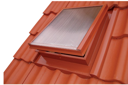
Obr. č. 4c