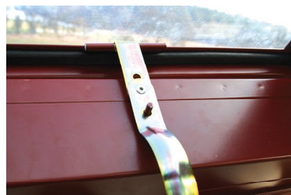
Obr. č. 6