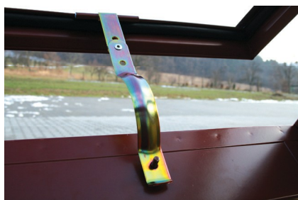
Obr. č. 7