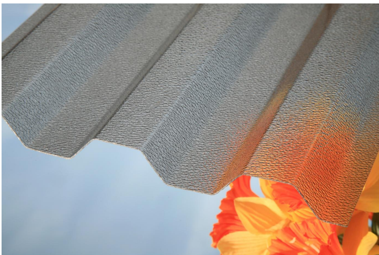
MARLON CSE TR 76/16 0,8 mm ORIGINAL bronz