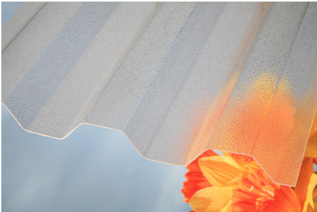
MARLON CSE TR 76/16 0,8 mm ORIGINAL čirá