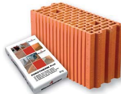
ČSN EN 771-1

Pro založení stěn se dodává požadované množství zakládací malty Porotherm Profi AM (Anlegemörtel).