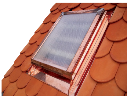
Obr. č. 1c