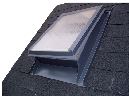
Obr. č. 1b