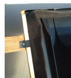
Obr. č. 2b