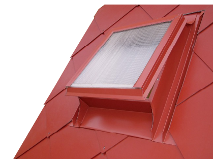
Obr. č. 1d