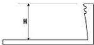
Tvarovací profil „L“ - Al přírodní, Al elox